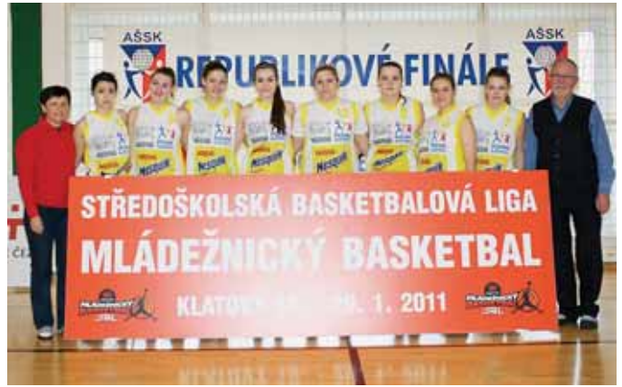
Úspěšný tým hejčinských basketbalistek.

pět nejlepších hráček republikového finále. V soutěži hochů zvítězilo družstvo Gymnázia Matyáše Lercha Brno, když ve finále porazilo tým pořadající školy, Gymnázium Klatovy. Na třetím místě skončilo Gymnázium Děčín. (mc)