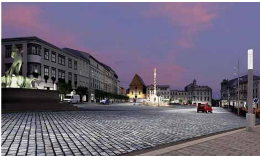
Vizualizace budoucí podoby Dolního náměstí po opravách.

Georadarový průzkum by měl urychlit archeologické práce přesnějším zaměřením předpokládaného výskytu románských kaple a kosterních pozůstatků v dané archeologicky velmi exponované lokalitě. Vlastní zpřesnění může výrazně kladně ovlivnit i průběh následných stavebních prací. Cena za obě etapy georadarového průzkumu je 255 tisíc korun, z toho cena za 1. etapu je 105 tisíc korun. (mf)