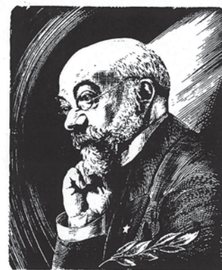
Dr. Ludvík ZAMENHOF * 15.12.1859 † 14.4.1917

(Zdroj: www.wikipedia.org a www.esperanto.cz/cs )