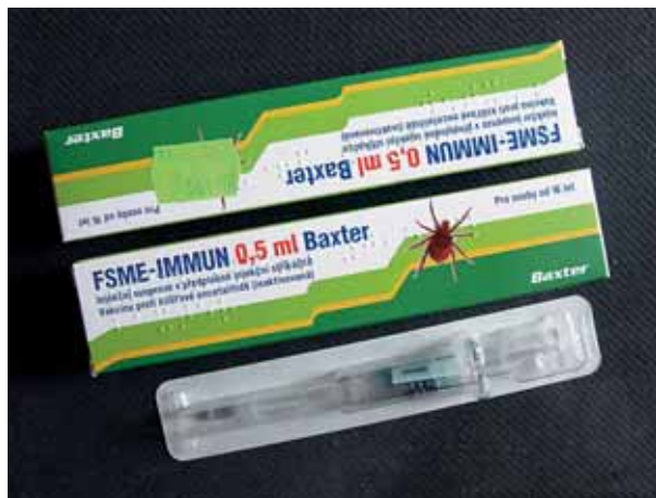
Vakcína proti klíšťové encefalitidě.

Více informací o klíšťové encefalitidě najdete na www.klistova-encefalitida.cz nebo na linkách 800 202 010 a 800 331 170. (mf)